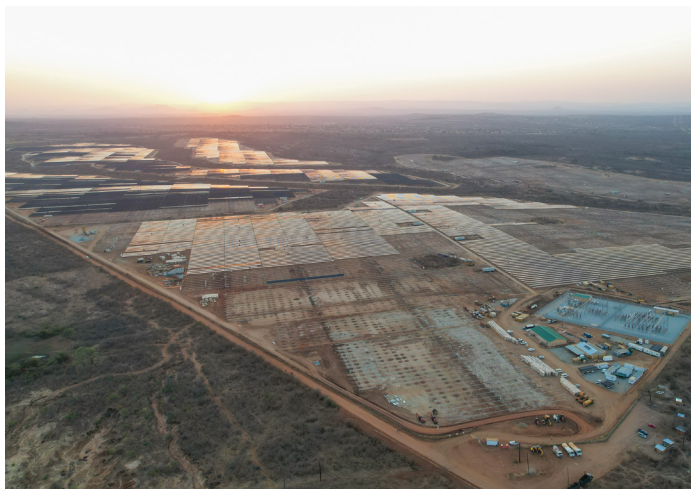
Bolobedu, Afrique du Sud | 148 MW

Voltalia concentre ses ressources sur les pays les plus prometteurs, tout en se retirant des zones non stratégiques. L'activité se recentre sur trois technologies clés : solaire, éolien terrestre et stockage. La stratégie privilégie les partenariats pour accélérer la croissance tout en maîtrisant les risques et le capital. Enfin, les actifs non essentiels sont progressivement cédés.